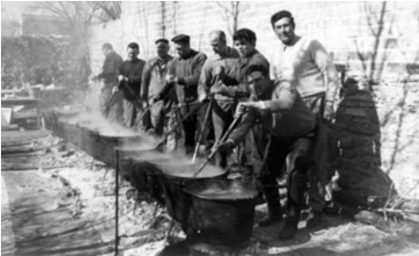
Col·laborant amb la sopa, cap allà els anys setanta.