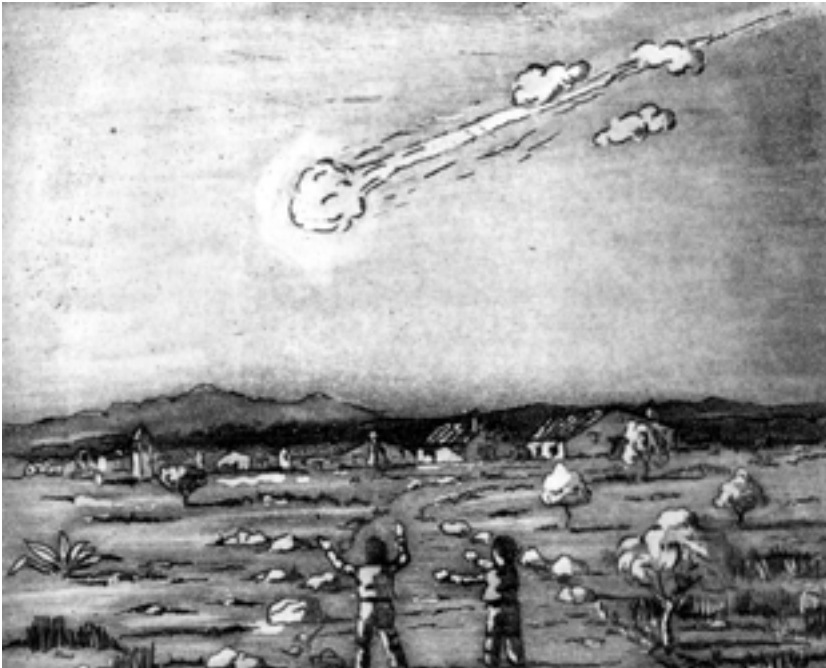
Restitució ideal de la caiguda del meteorit. F. Llorca, 2003.

réssim amb els ulls i la mentalitat de principis del s. XVIII entendríem fàcilment que els temors del nostre notari estaven plenament justificats. El 1704 faltaven encara noranta anys (!) perquè el físic alemany Ernst Chladni establís per primera vegada l'origen interplanetari dels meteorits. Fins aleshores es pensava en aquests fenòmens no com a fets naturals (cosa tan òbvia per a nosaltres avui en dia), sinó com a expressions de la voluntat divina.