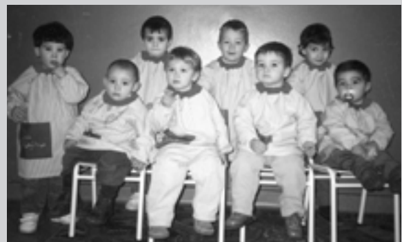
Els 8 primers alumnes de la Llar d'Infants.