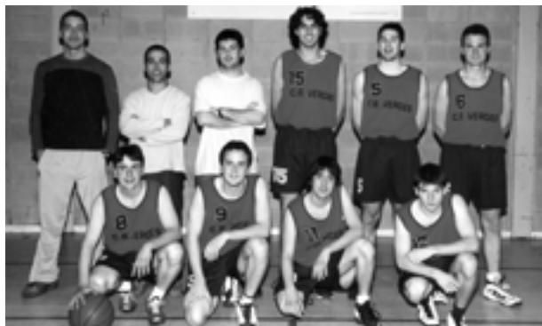
Sub-25 masculí, temporada 2001-02.