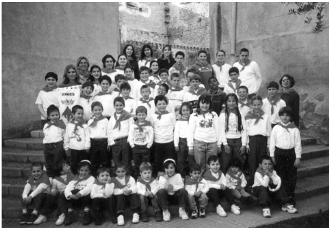
Trobada Sardanista Infantil a l'any 2001.