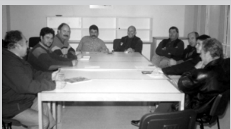
Membres de l'Associació durant una reunió.