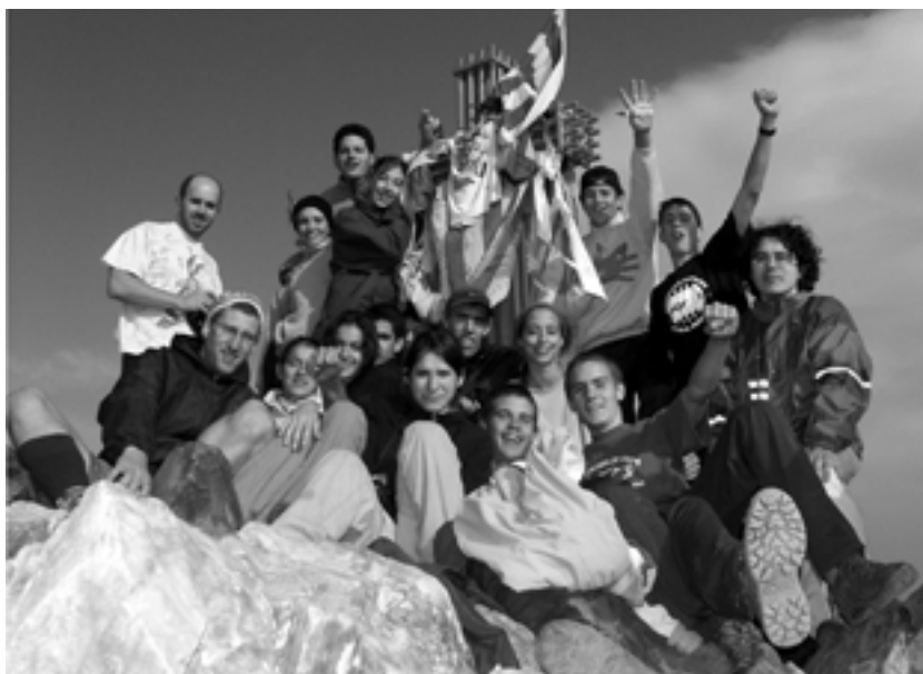
Ascensió amb el Grup de Joves al sostre de Catalunya, la Pica d'Estats (3.169 metres). Estiu 2003.

Els objectius que des de l'Associació s'intenten fomentar són la convivència i el diàleg, el coneixement i respecte de l'entorn i l'obertura de noves possibilitats de lleure, tant