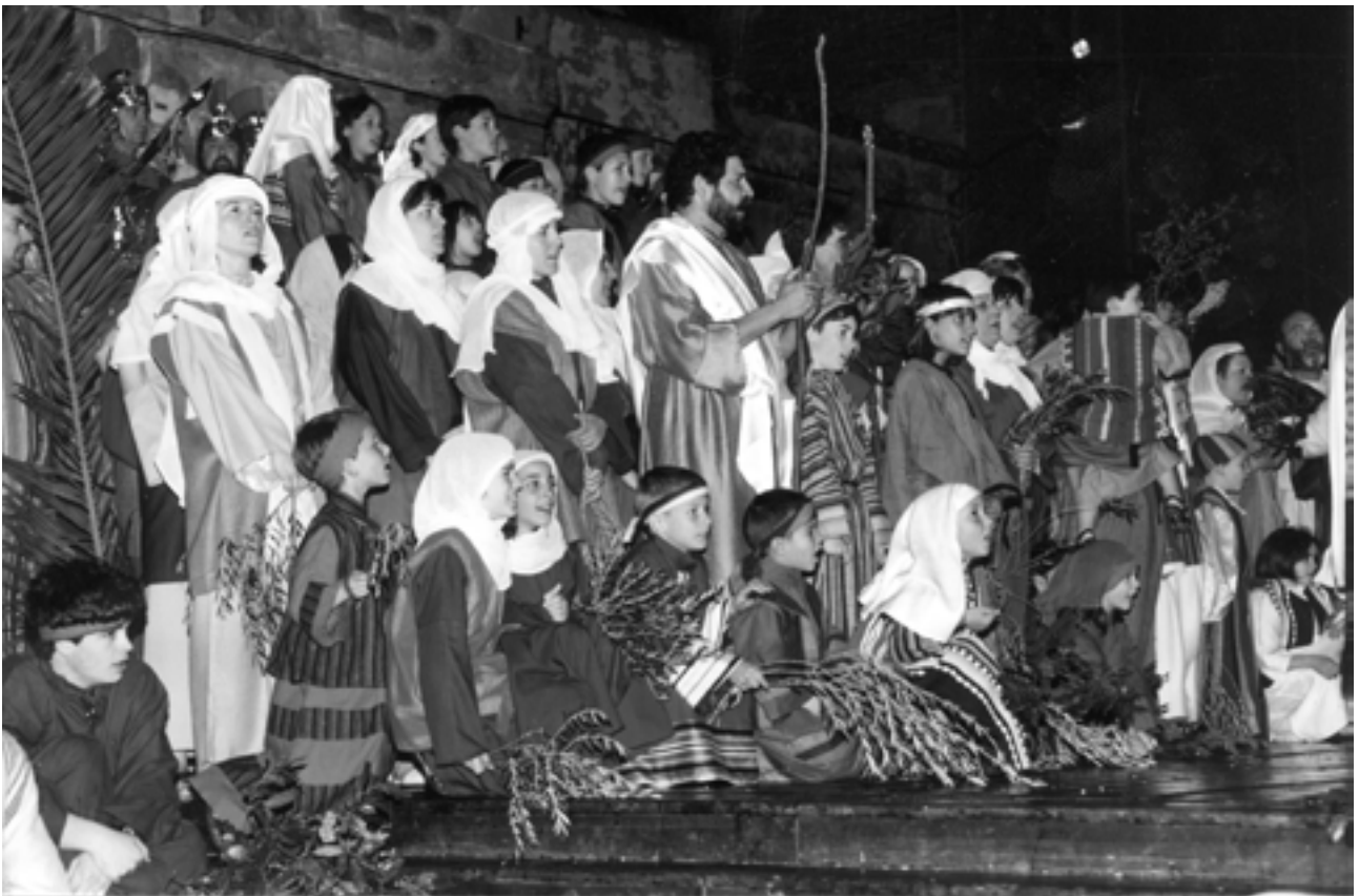
Imatge de l'escena del Ram.

I si teniu ganes de viure la processó tot l'any, aprofitant que aquest 2004 hi haurà eleccions, us animem a què us presenteu per ser membres de la seva Junta Directiva. L'associació està oberta a tothom.