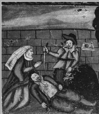
Apunyalament en ple carrer