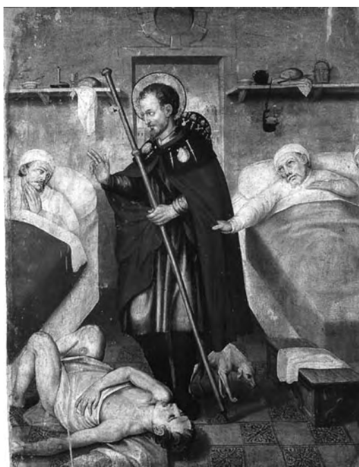
Sant Roc era invocat contra la pesta

a un camp d'en Sclanyà, a prop lo rec del Stany, per quant morí en las barrachas del mal contagiós . En realitat, ens trobem davant l'acció combinada de dues epidèmies diferents, la pesta i la malària, com queda clar en aquesta anotació que es troba en el registre de defuncions: 1592, juny havia en las Arrabassades arròs y en aquest temps havia en Verges pesta . Que el 1592 va ser un any particularment traumàtic per al poble de Verges ho demostra també la inscripció que durant molt de temps es pogué llegir en una finestra de la notaria: Any mil sinch cens noranta dos se feu arròs a les Sauledas, moriren-s-i cent persones . Davant un panorama tan dur i extremadament dantesc, que perduraria –amb intermi-