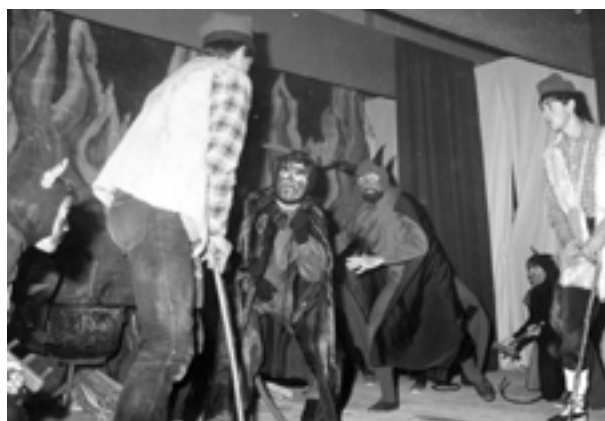
Escena d'"Els Pastorets" l'any 1984.