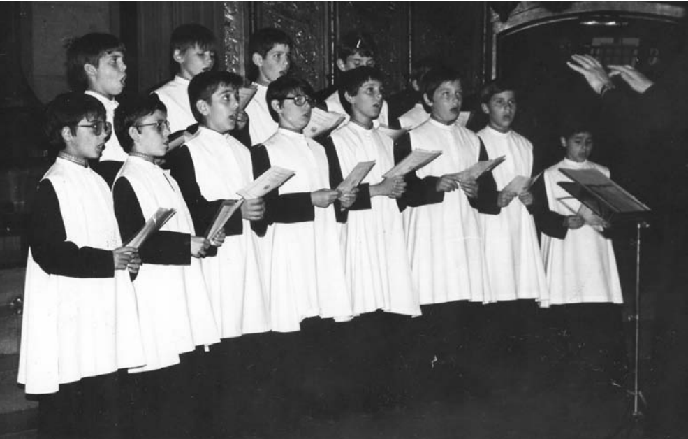
En Pau, segon a la dreta, cantant a l'Escolana de Montserrat

fer concerts, jo, en quatre anys, vaig anar a Portugal, a Israel, a Madrid i a molts pobles i ciutats de Catalunya. A part del cant coral, bàsic a l'Escolania, estudiàvem dos instruments: el piano i un altre triat per cada alumne.