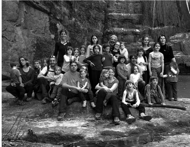
Sortida a la mina dels Bandolers

De cara a l'estiu ens queda l'acampada familiar de cap de setmana, programada per al 18, 19 i 20 de juliol. La zona escollida serà per les gorgues de la Garrotxa; així podrem fer caminades ben refrescants. Esperem que el temps ens acompanyi i puguem gaudir tots plegats de la sortida. Publicarem més informació a la nostra pàgina web.