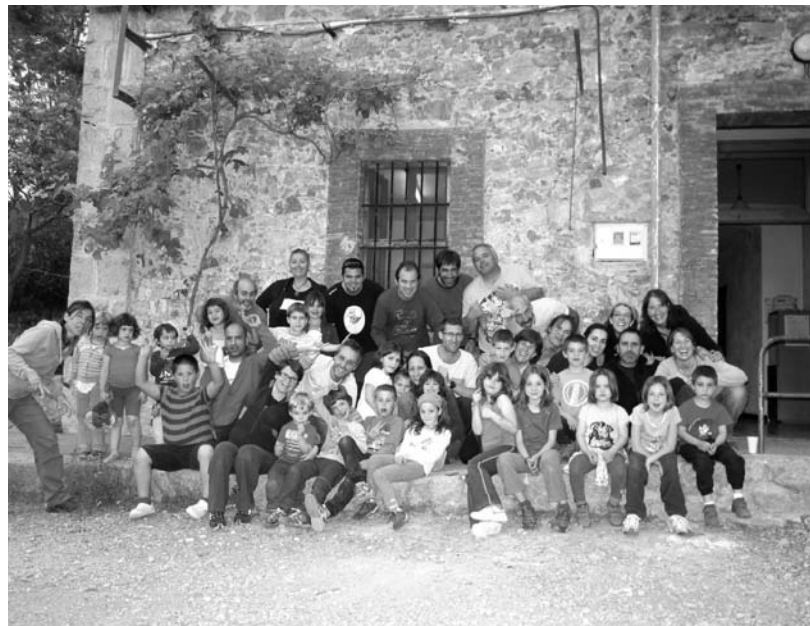
Sortida de cap de setmana al massís del Montgrí